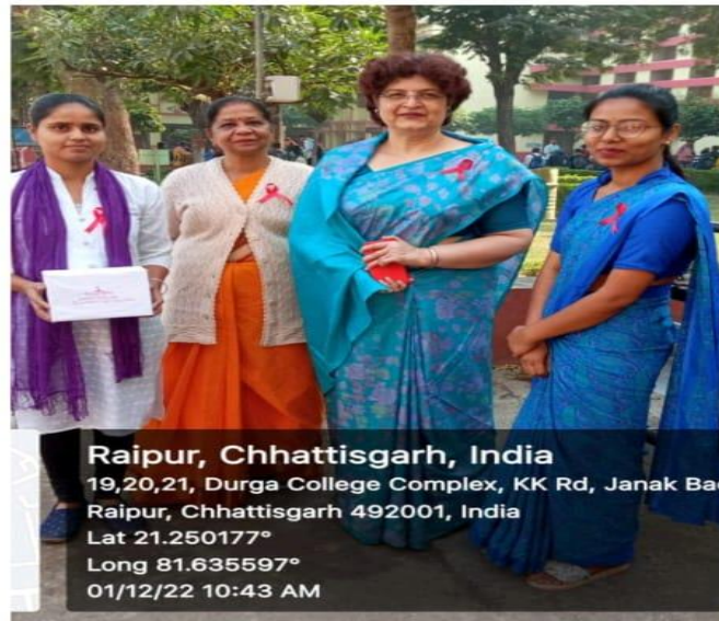
Raipur, Chhattisgarh, India 19,20,21, Durga College Complex, KK Rd, Janak Bada Raipur, Chhattisgarh 492001, India Lat 21.250177° Long 81.635597° 01/12/22 10:43 AM