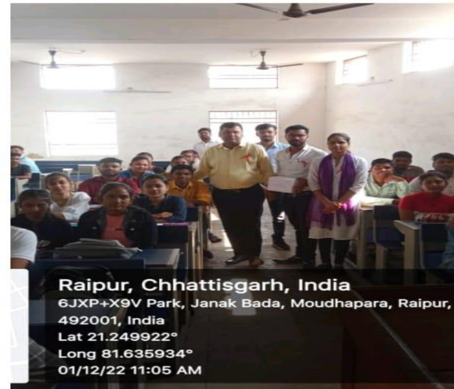
Raipur, Chhattisgarh, India 6JXP+X9V Park, Janak Bada, Moudhapara, Raipur, C 492001, India Lat 21.249922° Long 81.635934° 01/12/22 11:05 AM